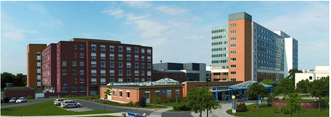
Abbildung: Dietrich-Bonhoeffer-Klinikum Krankenhausbereich: Salvador-Allende-Straße, Neubrandenburg